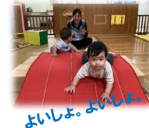
よいしょ、よいしょ。