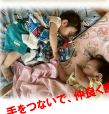
手をつないで、仲良く昼寝(=)ZZZ