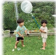
あっ!? あっちにちようちよ