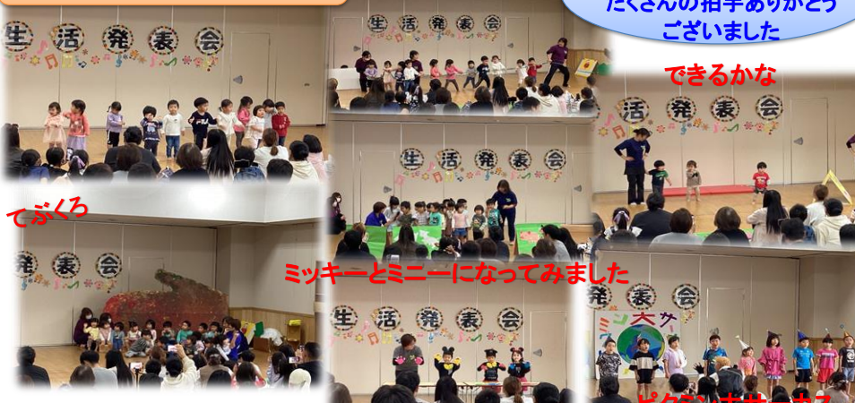
ミッキーとミニニーになってみました