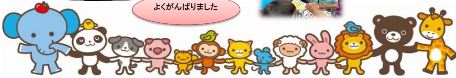
よくがんばりました