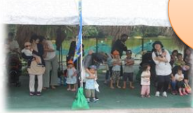
動物園楽しかったよ(▽▽)