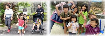
スタンプラリー頑張ったよ!